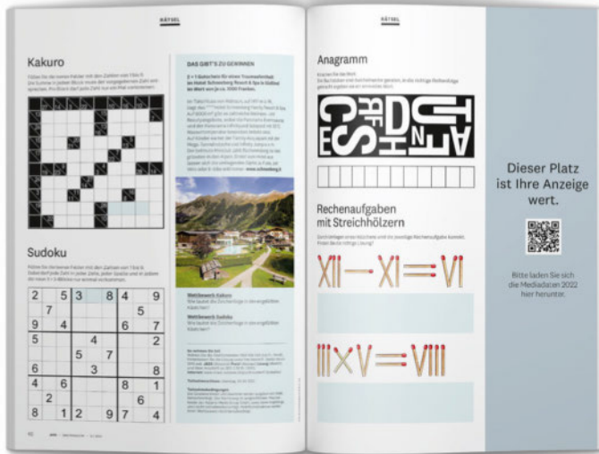
Format 76 x 297 mm, RA Preis pro Ausgabe 2000.-

Platzieren Sie Ihr Inserat auf den Spieleseiten und profitieren Sie von besonders hoher Beachtung sowie extra langer Verweildauer der Leserinnen und Leser.